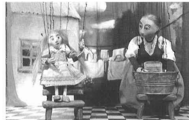
Die Geschichte vom Brüderchen (Marionettenspiel nach Fallada)

Eintritt: 1,50 € Erwachsene – 0,50 € Kinder bis 12 Jahre